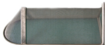
Filtere en T DN 80 à 800