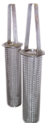
Panier filtrant DN 100 x 500