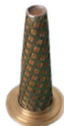
Filtere Temporaire Tronconique