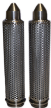
Cart. filtrant SOE Embout type B